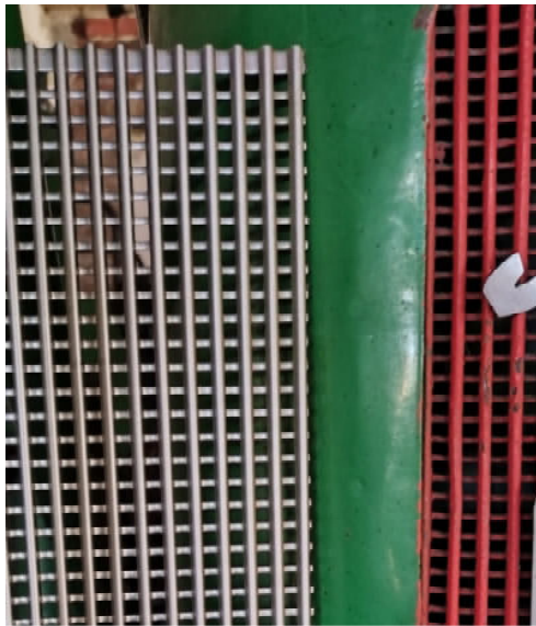
Original & Nachbau