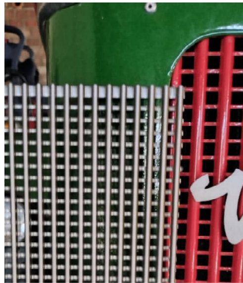
Original & Röhr Gitter